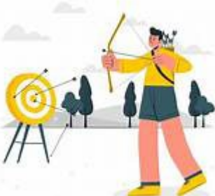
TIR A L'ARC