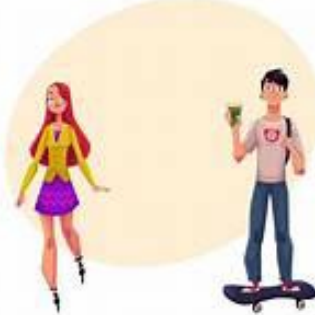
ROLLER - SKATEBOARD